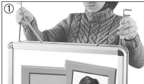
1.-3. Ref. Nr. BSAW = 1 Set